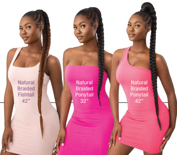
Natural Braided Fishtail 42"

AVAILABLE COLORS: 1, 1B, 2, DR2T1B/2730, DR2T1B/30, DR2T1B/350