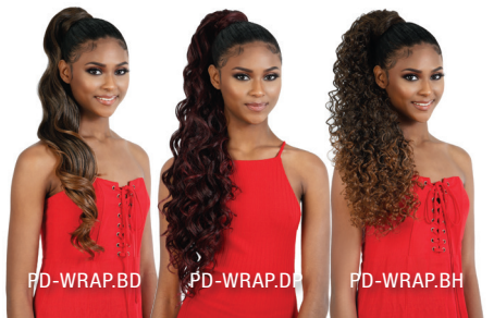
PD-WRAP.BD PD-WRAP.D PD-WRAP.BH