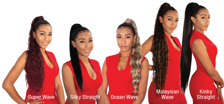
Super Wave Silky Straight Ocean Wave Malaysian Wave Kinky Straight

머리를 묶은 부위에 랩을 돌려 묶음으로써 간편하면서도 스타일리시하게 연출할 수 있다. 타사 제품에 비해 본체와 랩 부분의 모양이 많아 좀더 풍성해 보이는 것이 특징. 스타일은 Straight, Kinky Straight, Malaysian Wave, Super Wave, Ocean Wave, 길이는 18", 24", 34", 36" 로 다양하다. 특히 Kinky Straight는 흑인들이 좋아하는 야키 텍스처로 인기가 높다.