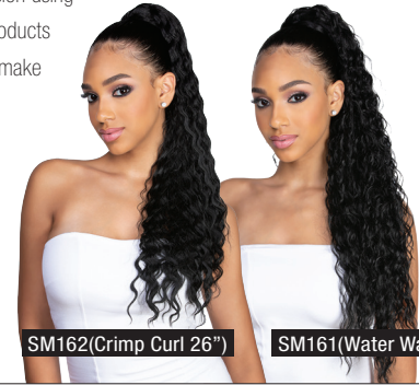
SM162(Crimp Curl 26")

AVAILABLE COLORS: 1, 1B, 2, 4, 613, FS1B/30, FS1B/BG, FS4/30