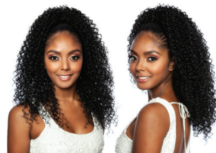
Key Curl WNT 20"

Brown Sugar® 시리즈의 베스트 셀링 아이템으로 타이트하고 풍성한 컬이 특징인 스타일. 조절 가능한 comb 과 drawstring strap으로 빠르고 쉽게 스타일링 할 수 있는 장점이 있다.